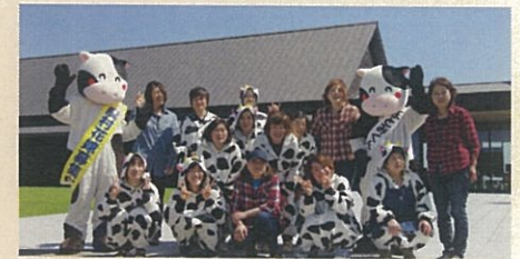
ゴミのポイ捨て防止啓発活動