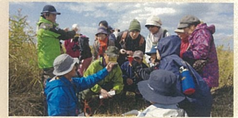
サロベツ・エコモ-ツアー